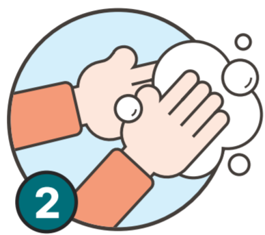
2 손소독 등 개인위생 수칙 준수