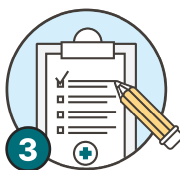
3 대상자, 보호자는 코로나19 증상 있을 시 방문 전 알리기